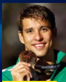
CHAD LE CLOS